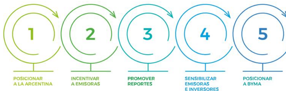
Fig. 2. Objetivos de BYMA